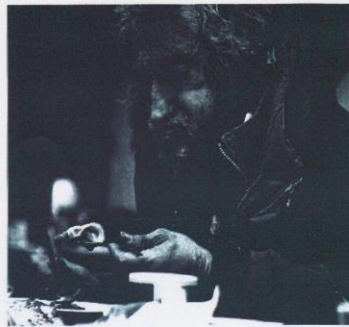
Caritas Erdlözese Wien

An den Verein Funktionsmodellbau 1110 Wien